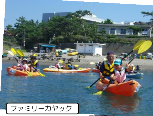
ファミリーカヤック