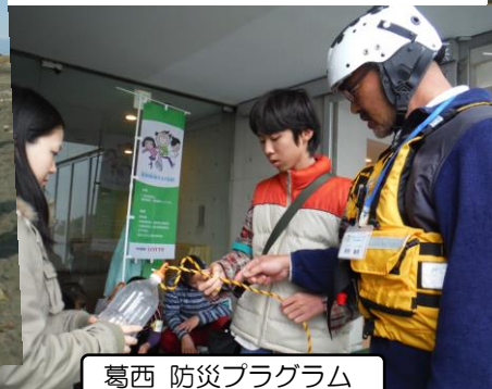
葛西 防災プログラム