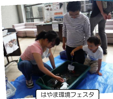
はやま環境フェスタ