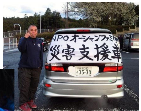
ちよくさん、支援物資を現地へ！