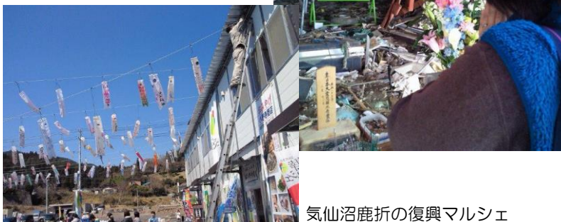
震災一年後の陸前高田市の市役所にて