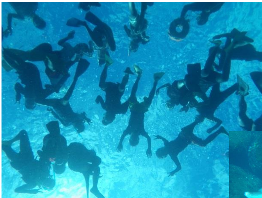
透明度の良い三宅島の海