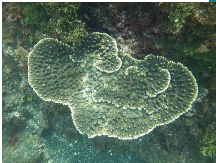
富賀浜のテーブルサンゴの群落