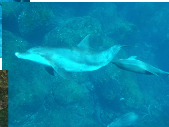
御蔵島周辺に生息するミナミハンドウイルカ 今年は30頭以上の親子の群れに遭遇しました