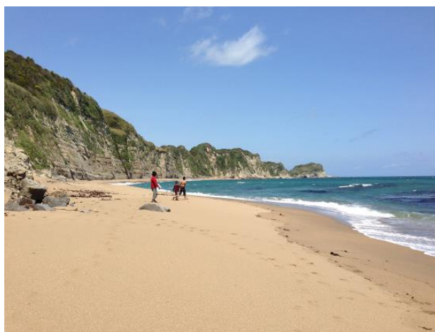
頑張ったご褒美はこの絶景！！

おんじゅく DE 元気の活動についてはホームページ ( http://onjuku-de-genki.org ) をご覧ください。 Facebook ( http://www.facebook.com/onjuku.de.genki ) もよろしく～♪